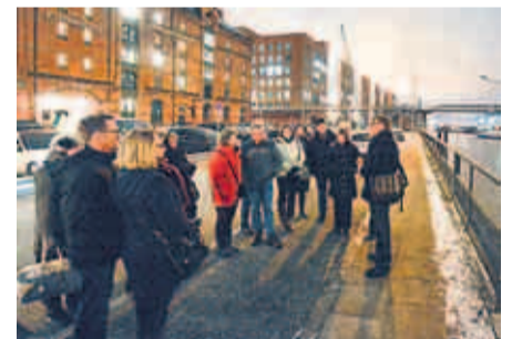
Zum Rundgang gehören auch Informationen zur Speicherstadt-Architektur

Speicherstadt-Genusstour Fr 13., 17.00, Treffpunkt: Speicherstadt Kaffeerösterei