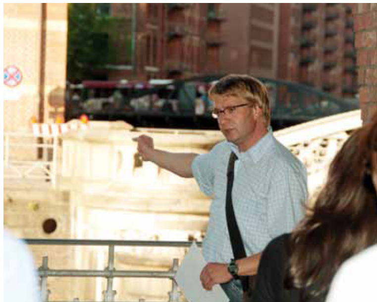
Bei den Rundgängen in der HafenCity sind immer wieder Rätsel zu lösen