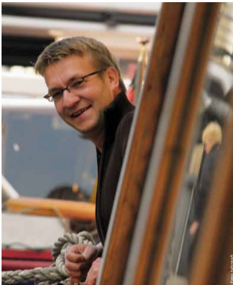
Auf einer Barkasse fühlt sich der Architekt am wohlsten