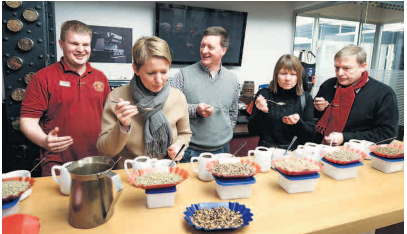
Kaffee löffeln – die unterschiedlich gerösteten Sorten lassen sich so leicht verkosten

Da wird gerochen, geschmeckt, gefühlt. In der Speicherstadt Kaffeerösterei geht es los. Informativ und mit zahlreichen Anekdoten gespickt erzählt Betriebsleiter Laube von dem mühevollen Kaffeeanbau, der Ernte und der abschließenden Röstung. In schlichten weißen Kaffeekännchen bereitet er die unterschiedlichen Sorten zu, lässt die Teilnehmer nur von einem Löffel die mal mehr mal weniger edle Bohne probieren – und wer Profi ist, macht's wie beim Wein: Erst riechen, dann schlürfen und anschließend im Mund gurgeln lassen. Nur die Spucknapfe fehlen in dem etwas cleanen Seminarraum der Kaffeerösterei.